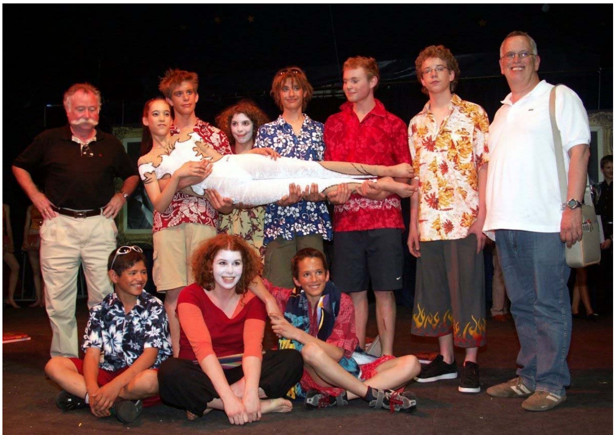
Grock d'Or 2005 à Neuchâtel, avec les lauréats et Eugène Chaplin